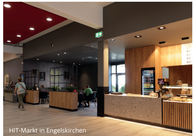
HIT-Markt in Engelskirchen

Die Geschichte von Schneider's Bäckerei begann 1957 mit einer kleinen Bäckerei in Siegen. Bereits in den 60er Jahren gab es die erste Bäckereitheke in einem Sieger Supermarkt. Heute beliefert Schneider's Bäckerei knapp 60 eigene Standorte. Seit jeher setzt das Familienunternehmen auf 100% Handwerk. 2024 übernahm Schneider's die Engelsbäckerei Felder mit einer Vielzahl an Standorten.