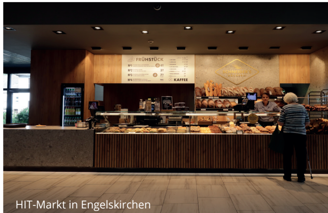
HIT-Markt in Engelskirchen