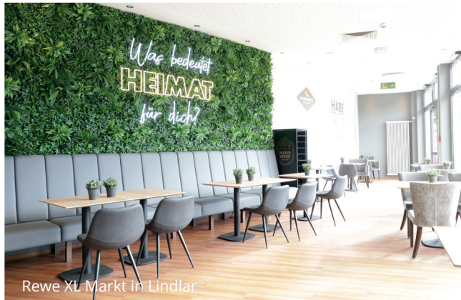
Rewe XL Markt in Lindlar